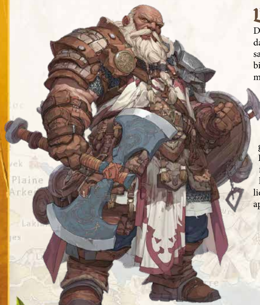
Lord Forgistère DonnHerin de Bohoor