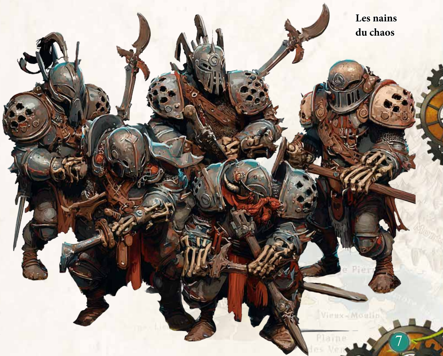
Les nains du chaos

Le combat fait rage. Selon la tournure des événements (et la volonté du Maître du Jeu) la prêtresse ogre peut invoquer le pouvoir du monolithe pour soigner, voire ressusciter, ses alliés. Mais une fois les aventuriers victorieux, une présence maléfique semble emplir la salle. Le monolithe, source de cette corruption, ne peut être neutralisé qu'en lui infligeant 400 points de dégâts structurels. Il faut aussi briser son lien avec l'hydrale de la terre, tapie dans la salle inférieure. À l'extérieur, des pèlerins ogres, alertés par le tumulte, s'agglutinent de l'autre côté du pont, prêts à en découdre.